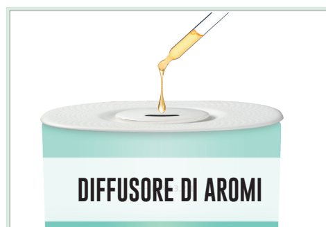
DIFFUSORE DI AROMI